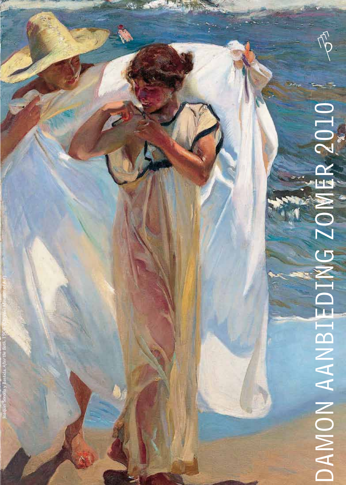
Joaquín Sorolla y Bastida, After the Bath , 1908 (Cryselor Museum of Art)